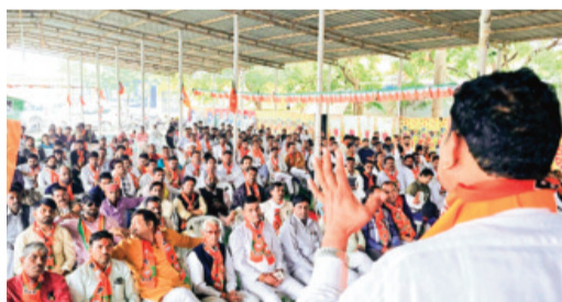
हरिभूमि न्यूज़ ॥ राजगढ़

मुख्यालय स्थित मंगल भवन परिसर में भाजपा के जिला स्तरीय युवा सम्मेलन का आयोजन किया गया। कार्यक्रम के मुख्य