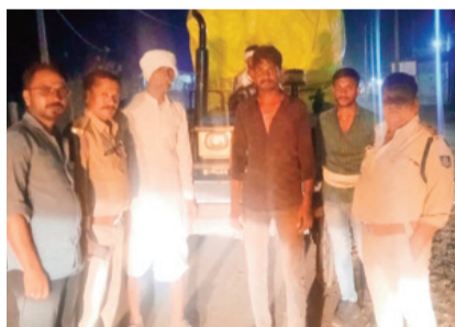
हरिभूमि न्यूज़ ॥ राजगढ़

अवैध लकड़ियों से भरे 2 ट्रैक्टर-ट्रॉली किए जब्त