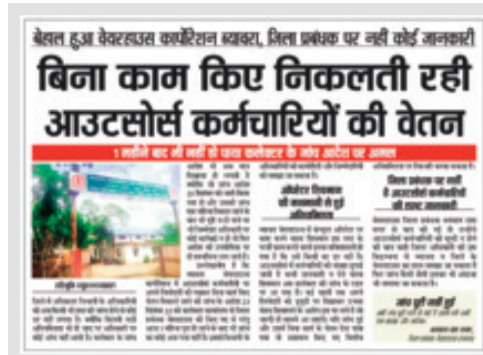
हरिभूमि न्यूज़ ॥ ब्यावरा

उपार्जन के समय वेयरहाउस कर्मचारियों की बढ़ती संख्या तो ठीक परंतु उपार्जन के बाद भी उतने ही कर्मचारियों का लगातार कई वर्षों से काम करते रहना ब्यावरा वेयरहाउस प्रबंधक पर प्रश्नचिह्न लगाता है। जब उपार्जन के बाद कम काम है या काम नहीं है तो भी सरकारी पैसे का दुरुस्योग क्यों किया जा रहा है। यह हाल है ब्यावरा वेयरहाउस का जहां पर आउटसोर्स कर्मचारी अपनी मनमौजी प्रथा के चलते बिना रोक टोक अनुपस्थित आउटसोर्स कर्मचारियों को उपस्थित बताने में कोई कसर नहीं छोड़ रहे हैं। वहीं वेयरहाउस ब्यावरा में