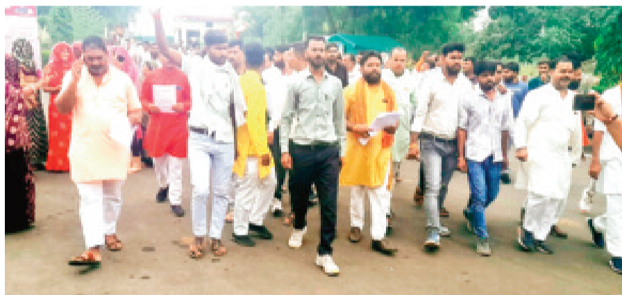
हरिभूमि न्यूज़ ॥ राजगढ़

विगत 22 अक्टूबर को जीरापुर क्षेत्र के गांव गागोरनी में रास्ते के पुराने विवाद को लेकर समुदाय विशेष से जुड़े कुछ लोगों ने दूसरे पक्ष पर धारदार हथियारों से हमला कर दिया था। इस हमले में बैरागी समाज के कई लोग घायल हो गए। जिनमें से कुछ को झालावाड़ रेफर करना